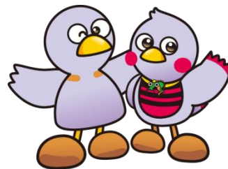
埼玉県のマスコット「コバトン」「さいたまっち」